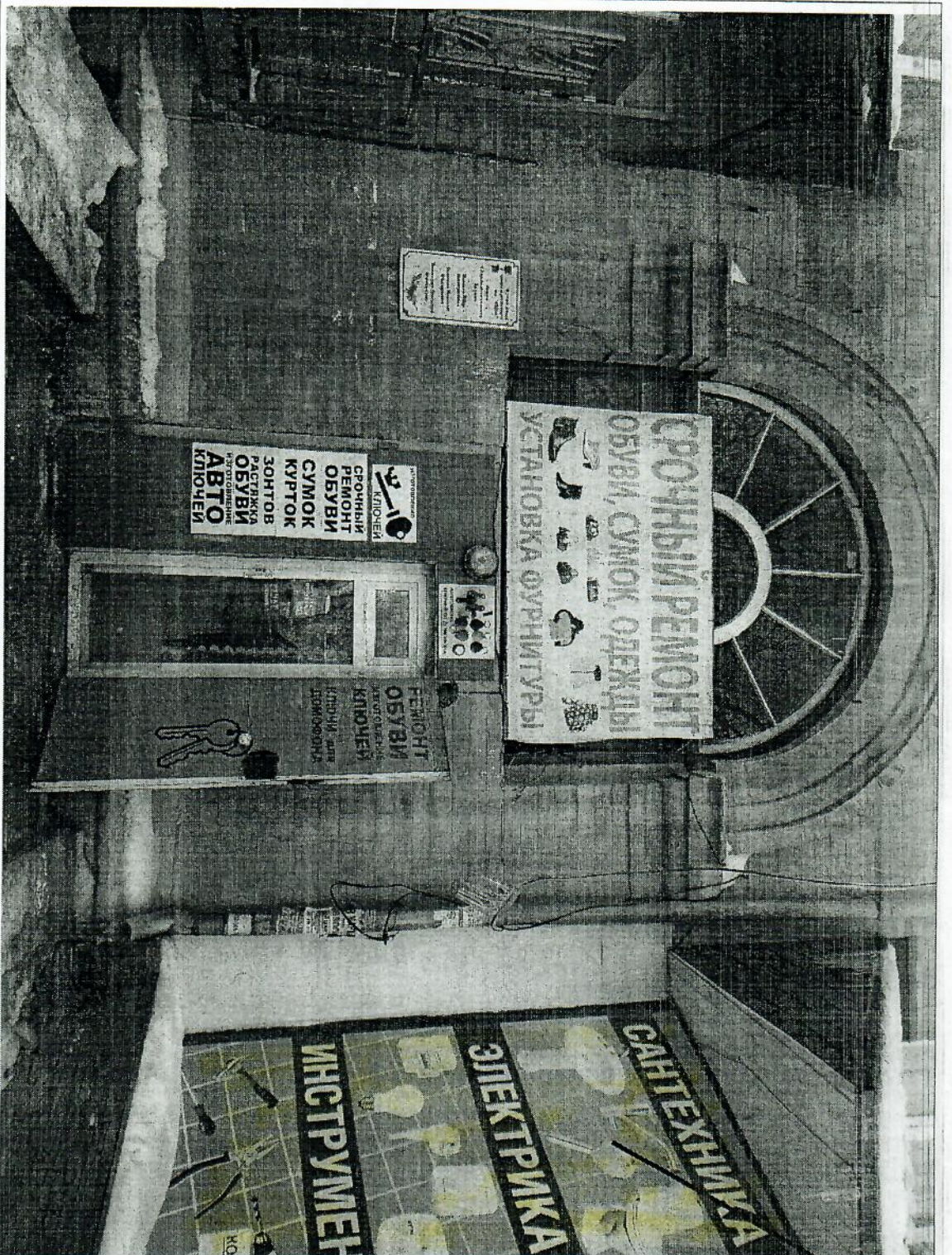
Иллюстрация № 5: Вывеска № 4 (1 этаж) "САНТЕХНИКА ЭЛЕКТРИКА ИНСТРУМЕНТ" расположена вертикально, нарушает пп. 1 п. 24, согласно которому запрещается размещение Вывесок с использованием картона, ткани, баннерной ткани.

Вывеска № 4 "САНТЕХНИКА ЭЛЕКТРИКА ИНСТРУМЕНТ"